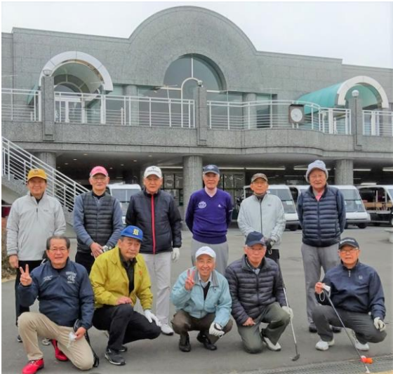
ゴルフ同好会 2022年2月2日

この中で一番活動しているのが「ゴルフ同好会」。年に11回、8月を除き毎月コンペを開催しています。宮崎はゴルフ天国。宮崎