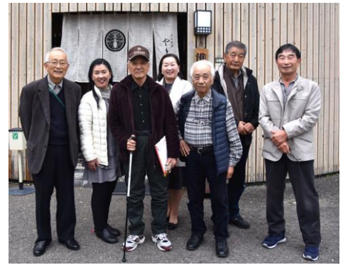
あすなる川柳会 2018年12月 盛会だった頃の写真です

市中心部から30分以内で行けるゴルフ場は実に11か所。料金も平日セルフであれば食事付で7千円以下の所が大半。現在のコロナ禍でも15名のメンバーが楽しんでいきます。