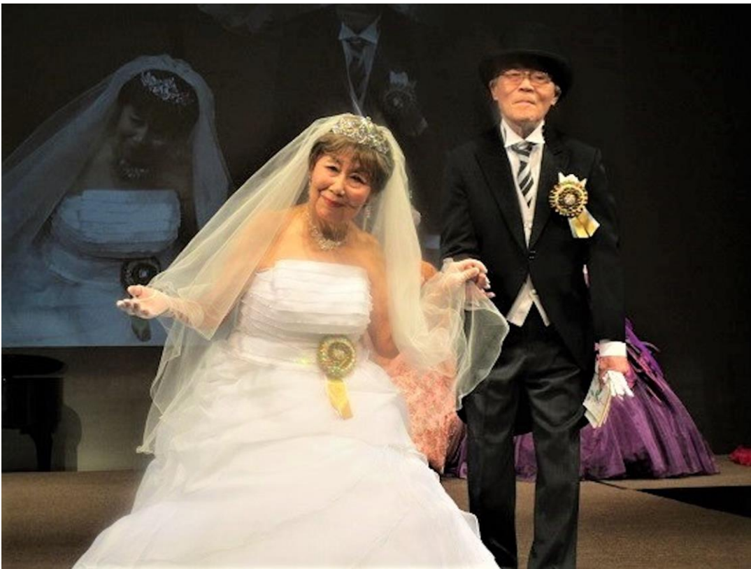
大分はつらつフェスタからのひとコマ おふたりとも90代の“金婚式ブライダル・ショー”