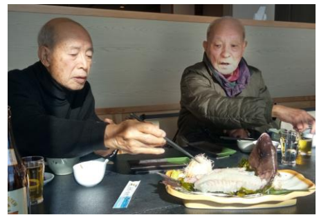
鯛の活造り(左側筆者)

み、ビールで乾杯！真鯛姿造りや河豚の空揚げ等で、実力に応じ一献傾けながら季節の味覚を満喫。何しろ裸の付き合い、和気あいあいと寛ぎ、流れ解散の後、大半は師崎へ足を延ばしましたが、自分はホテルに留まりキラキラ光る海を飽きずに眺めていました。オミクロン株が不気味ですが、凌いで、また何処かへ…。