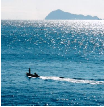
ホテルから望む三河湾、金波銀波沖の神島

令和3年を締め括る「湯遊会」は、名古屋駅から名鉄で河和へそこから知多バスに乗り継ぎ、「美舟」へ。同志10名、温泉を堪能後、レストランのテーブルを囲