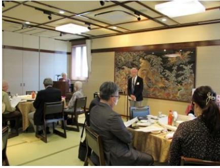
野村会長の挨拶から総会開始

九州民放クラブ福岡の、対面での定時総会・懇親会が4月20日(木)、福岡市中央区今泉の中華「福新楼」で開催されました。前回開かれたのは2019年4月ですから、今回実に4年ぶりに対面での総会でした。その間、思いもかけないコロナ過で顔を合わせたの会議や懇親会、クラブ活動の殆どが中止を余儀なくされ、総会議案は書面議決での承認となっていました。